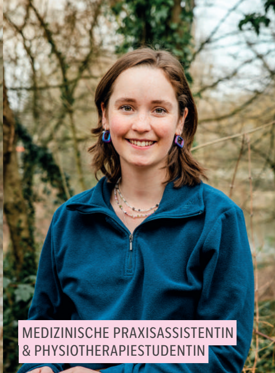
MEDIZINISCHE PRAXISASSISTENTIN & PHYSIOTHERAPIESTUDENTIN

Präsident Bildungskommission Dornach, Präsident GRÜNE Dornach, Suppleant Gemeinderat, Mitglied Natur- und Vogelschutzverein