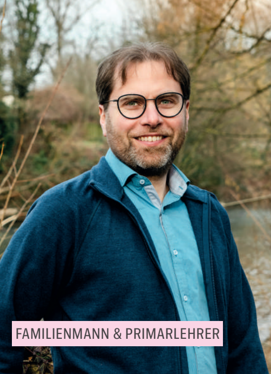
FAMILIENMANN & PRIMARLEHRER